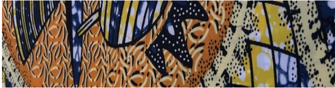
Codice riferimento: T04