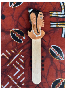
SEGNALIBRO Nome: Donna Africana Colore: naturale

Prezzo: 4.00 Euro Codice riferimento: S01