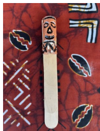
SEGNALIBRO Nome: Tam Tam Colore: differenti possibilità