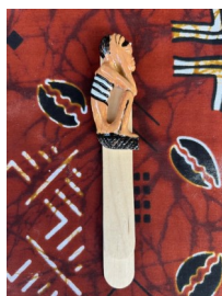
SEGNALIBRO Nome: Uomo pensante Colore: naturale

Prezzo: 4.00 Euro Codice riferimento: S01