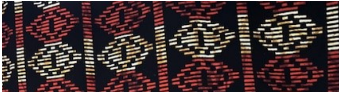
Codice riferimento: T01