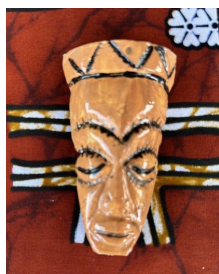
QUADRETTO Nome: Maschera Africana Colore: marrone/nero Stoffa pannello: a scelta

Prezzo: 6.00 Euro Codice riferimento: Q01