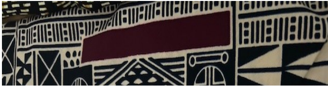
Codice riferimento: T02