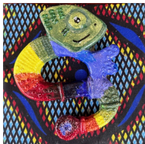
QUADRETTO Nome: Camaleonte Colore: diversi colori Stoffa pannello: variopinta

Prezzo: 6.00 Euro Codice riferimento: Q01