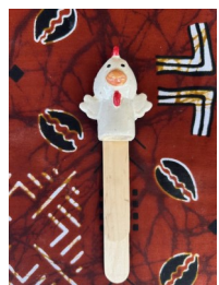
SEGNALIBRO Nome: Gallo Colore: bianco o nero o giallo