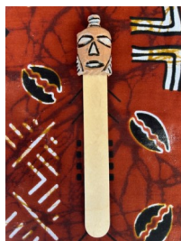
SEGNALIBRO Nome: Maschera 2 Colore: naturale

Prezzo: 4.00 Euro Codice riferimento: S05