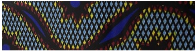
Codice riferimento: T05