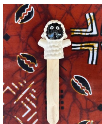
SEGNALIBRO Nome: Pecora Colore: bianco o nero

Prezzo: 4.00 Euro Codice riferimento: S05