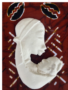
QUADRETTO Nome: Mamma con Bambino Colore: bianco Stoffa Pannello: a scelta Disponibile anche inversione colorata