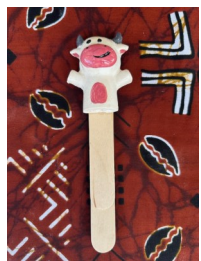
SEGNALIBRO Nome: Mucca Colore: differenti possibilità