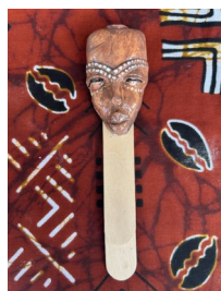
SEGNALIBRO Nome: Maschera 1 Colore: naturale